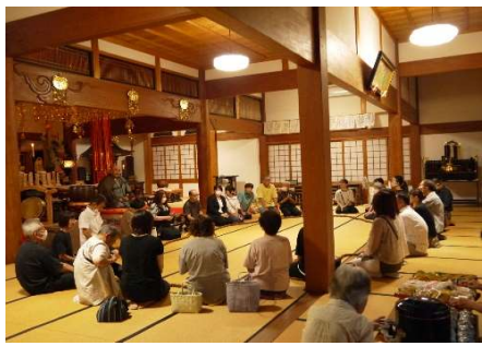
八月十五日(木) 精霊送り