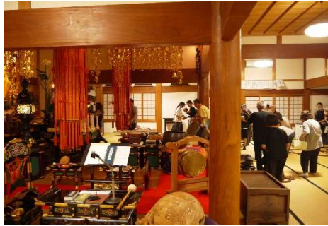
木魚収納のご協力 ありがとうございました。